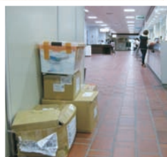
④本当に温かいご支援を頂いております

被災地の復興にはまだまだたくさんの力と時間が必要です。私達も微力ながら何か出来ることは無いかと今後も継続的に支援活動を行ってまいります。豊かな水と緑の町「ひろしま」この広島が元気を取り戻すまで、頑張ります。