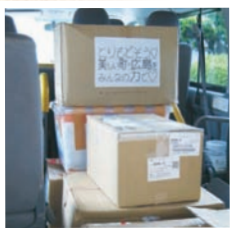
②多くの方々から救援物資や義援金を賜りました