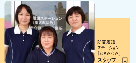
訪問看護ステーション「あさみなみ」スタッフ一同

昨年9月に訪問看護に入職されました。キャリアもあり訪問看護に対する熱意もあり、みんなが影響されている雰囲気を作ってもらっています。そして、事務所全体の熟年パワーもアップ! いつでも前向きな姿勢で、利用者様にも親しまれています。これからも明るい性格で邁進してください。