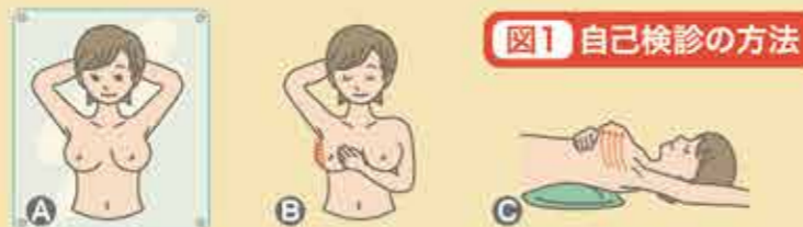
図1 自己検診の方法

乳がんは自分で発見できる数少ないがんの一つであり、自己検診が大切です。月に一度は自己検診を行ってください。自己検診で乳房の変化を感じた人は、乳がん検診を待たずに、直ちに精密検査を受けてください。