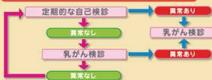
図2 乳がんから自分を守るための検診サイクル

なお、自己検診の方法は、【図1】を参考にしてください。自己検診で異常がなかった人も、乳がん検診を定期的に受けましょう。また、乳がん検診で「異常なし」といわれた場合でも、自己検診は続けましょう。それを繰り返してください【図2】。マンモグラフィによる集団検診の対象とはならない40歳未満の人も、自己検診をしっかり行うことが大切です。