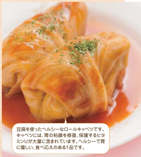
豆腐を使ったヘルシーなロールキャベツです。キャベツには、胃の粘膜を修復、保護するビタミンUが大量に含まれています。ヘルシーで胃に優しい、食べ応えのある1品です。