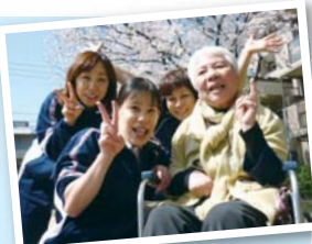
平成25年4月3日～5日 通所リハビリテーション

風に舞う桜の花びらを眺めながら、午後のひとときを通所者の皆様と過ごしました。記念写真を撮ったり、お菓子を食べたり、自然とおしゃべりの声も大きくなって、(^o^) 最近では、アルコールとカロリーがフリーのビールの味が格段に良くなっていくらしく、なぜかほっぺたがほんのり桜色になっていっちゃう方も…。病院のすぐそばにこんなきれいな桜があるなんて…。来年のこの時期を楽しみに、また1年がんばりましょう!