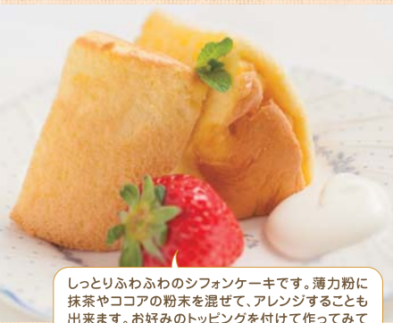
しっとりふわふわのシフォンケーキです。薄力粉に抹茶やココアの粉末を混ぜて、アレンジすることも出来ます。お好みのトッピングを付けて作ってください。